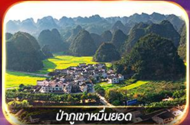
ป่าภูเขาหมื่นยอด