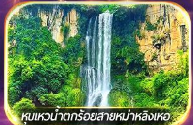
หุบเขาน้ำตกร้อยสายหม่าหลิงเหอ

ชมวิถีชีวิตหมู่บ้านปู้อี้ยามค่ำคืน, ล่องเรือทะเลสาบว่างเฟิงหู ชมสวนดอกไม้ตามฤดูกาล, ซอปปิ้งจุใจถนนคนเดิน