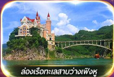
ล่องเรือทะเลสาบว่างเฟิงหู