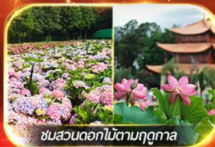
ชมสวนดอกไม้ตามฤดูกาล

นั่งกระเช้าสู่กุเขาสหะมังกรหยก ชมโชว์ทิเบต "Impression Lijiang" สุดอลัง เชคอินคาเฟ่วิวกุเขาสหะ, ชมดอกไม้ตามฤดูกาล