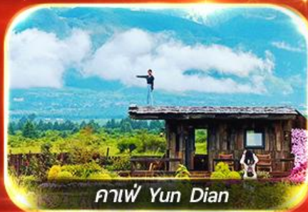
กาแฟ Yun Dian