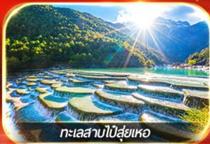
ทะเลสาบไม้ส่ายเหอ