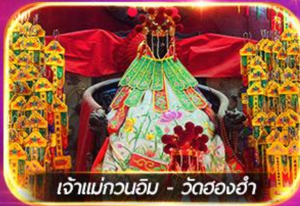
เจ้าแม่ทวนอิม - วัดฮ่องกง