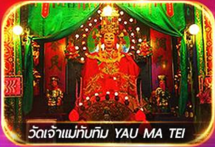
วัดเจ้าแม่ทับทิม YAU MA TEI