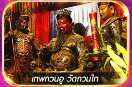
เทพทวนอู วัดทวนไถ

พามูไหว้พระขอพร 8 วัดดัง เล่นเครื่องเล่นดิสนีย์แลนด์เต็มวัน ชมพลุสุดอลังการ